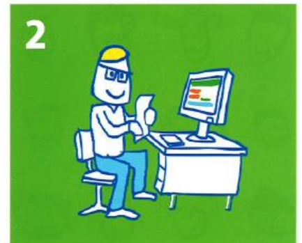
Kindpakket.nl behandelt de aanvraag