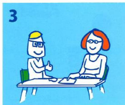
Een vrijwilliger van Kindpakket.nl komt bij de ouder(s) thuis om de aanvraag door te nemen