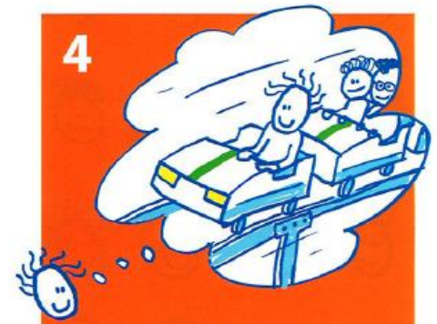
Als de aanvraag is goedgekeurd, zorgen wij voor betaling: het kind kan meedoen!