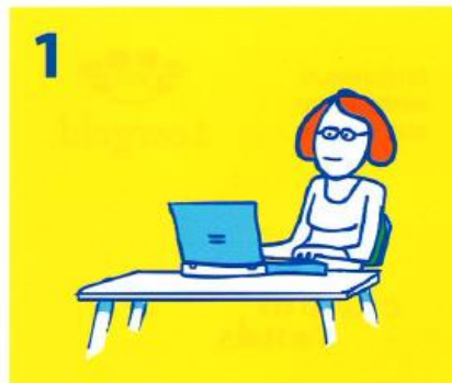
Ouders kunnen via Kindpakket.nl een vergoeding aanvragen

Op www.kindpakket.nl staan alle vergoedingen op een rij en kunnen ouders in vier stappen een vergoeding aanvragen. Zo kan elk kind meedoen!